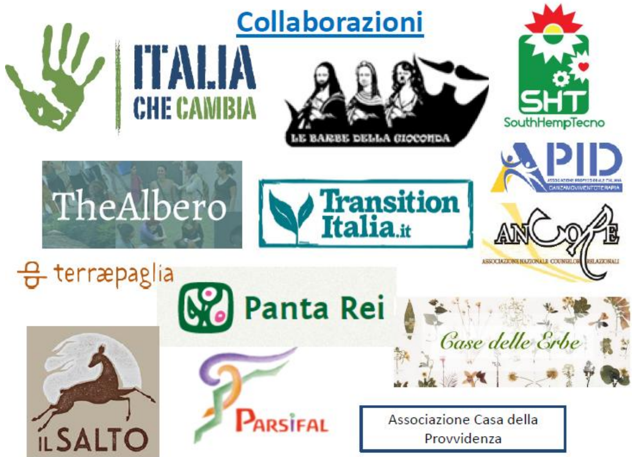
Figura 3. Loghi delle associazioni/organizzazioni che collaborano con Explore

analogo rapporto di interscambio con la Green School di Bali in Indonesia 12 , una istituzione no profit internazionale la cui mission è quella di creare una generazione di leaders 'ecologici' a livello globale.