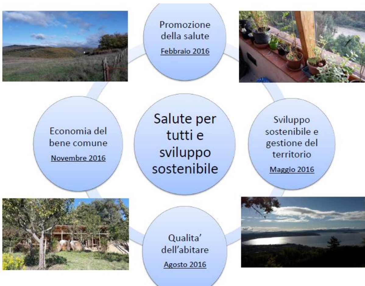
Figura 1. I 4 moduli del Campus 2016 'Salute per tutti e sviluppo sostenibile'

Il primo era relativo all'autovalutazione della conoscenza dei vari argomenti trattati e veniva compilato all'inizio ed alla fine del corso (valutazione pre-post); il secondo riguardava invece la valutazione complessiva dell'intero corso (target educazionali rispetto alla propria professione, corrispondenza tra programma e contenuti effettivamente trattati, materiale didattico, qualita' dei relatori e dei laboratori, ecc.) da parte dei partecipanti che avevano a disposizione per ogni singolo quesito una scala da 0 (punteggio minimo) a 7 (punteggio massimo). In generale, tutti i partecipanti hanno confermato di aver acquisito una maggior conoscenza dei contenuti alla fine del corso rispetto alla loro conoscenza iniziale, e anche la valutazione complessiva dei corsi e' stata estremamente positiva con un punteggio minimo di 6 ed uno massimo di 6,5 (Figura 2). Una giovane psicologa, partecipante al primo modulo, ha commentato: "sono arrivata qui con nessuna aspettativa, vado via con un baule che trasborda emozioni ed una consapevolezza acquisita".